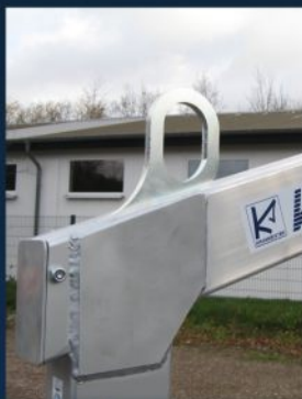
Einfaches Einhängen des Kranhakens