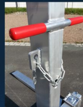
Praxisorientiert - gute Funktionalität und Handhabung