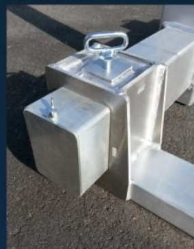
Verstellbare Gabelzinken, speziell geschweißte Profile für hohe Belastbarkeit