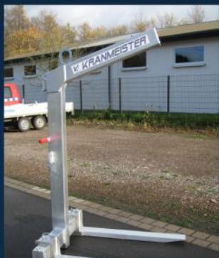
Automatischer Gewichts- ausgleich und wartungsfreies Druckfedersystem